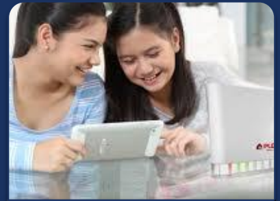
PLDT Subic Tel